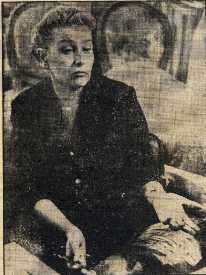
Министар културе СССР Јекатерина Фурцева предводио је Большиј театар у Италији

— Предвиђене су многе иницијативе и веома је тешко набројати их све. Напоменимо само да наш славни виољончелиста Растроповић ускоро долази у нашу земљу, у преговору је и гостовање балета Большог те-