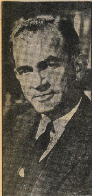
Вилдјем Фулбрајт, сенатор из Арканзаса

Године 1936. вратио се у Арканзас и почео да предаје на тамошњем универзитету. А када је три године доцније председник универзитета погинуо у аутомобилској несрећи, Фулбрајт је био изабран на његово место. Изгледало је да му је судбина предодређена, да ће читав живот провести у универзитетским аулама и слушаоницама.