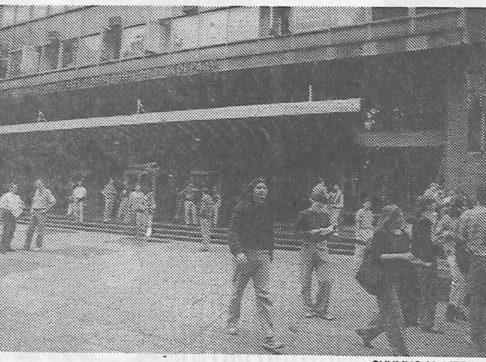
Чека ли их замка с оне стране „баре“: академци испред Машинског факултета у Београду

„У време када је ово путовање професор Нил планирао, нова Реганова влада је једва годину стару и сва наменована ове врсте захтевала су да предавачи буду у стању да објасне у таквом кругу (у СФРЈ – прим. А. В.) нашу нову научну политику. У источној Европи, где је професор Нил требало да путује, наши јавни радници се специјализују за окупљање мањих група професионалних слушалаца којима преносе информације недоступне у њиховим контролисаним срединама. Међутим, ми налазимо услове за стварање фондова за такав општи програм, погоднији за Фулбрајт и друге академске размене, било јавне или приватне. Такве стипендије омогућују дуже боравке и мно-