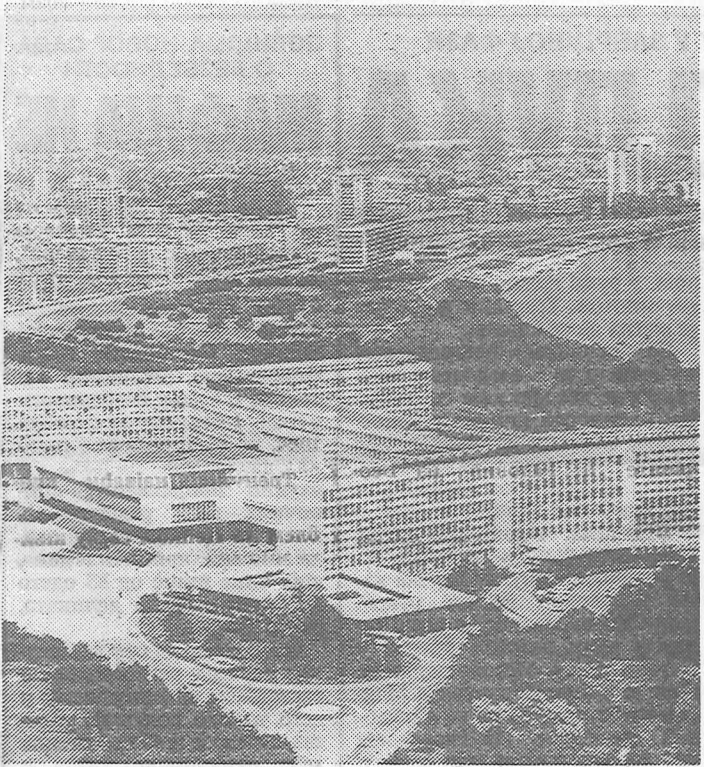
Немоћ наших савезних органа или нешто друго: зграда Савезног извршног већа

Срећа је што смо благовремено интервенисали. Да су је користили за јело, било би знатно оболелих - због јаке инвазије трихинеле - каже инспектор Стојић. Б. Пр.