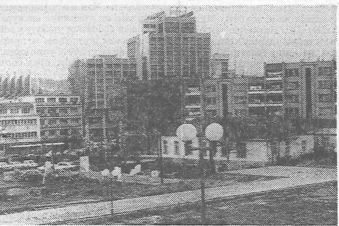
Уместо певања на Космету, интересовале су је „игре“ са овом покрајином: поглед на део Приштине