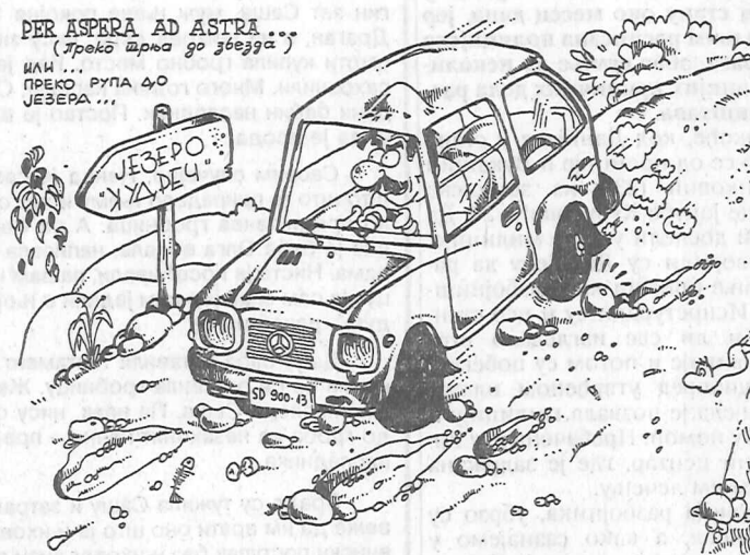
Прилог смеху на свој рачун смехотресне екипе Смедеревске Паланке