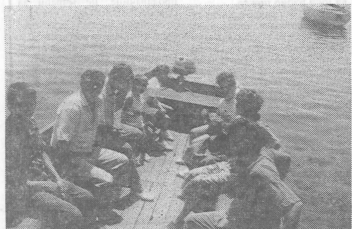
О политици не расправљамо: дружење не спречавају ни границе

● Пријатељство „сковано“ пре 12 година између мештана Тогочевца код Лебана и Волина близу Охрида ни сада није нарушено