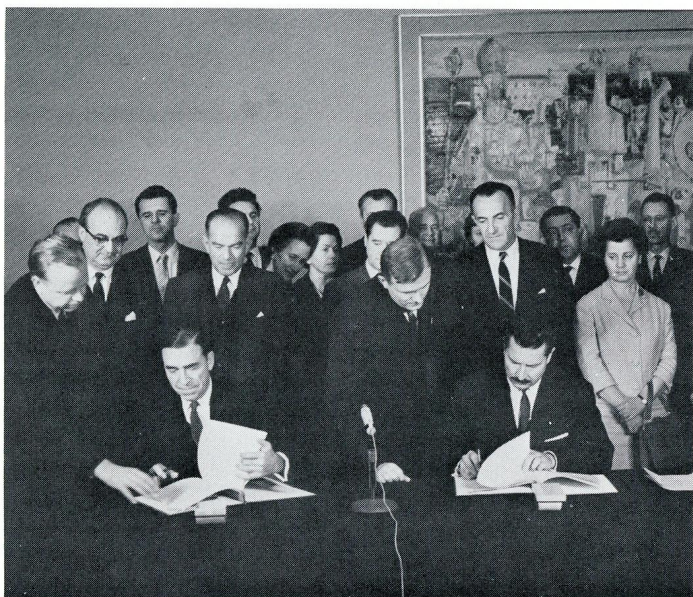
Potpisivanje sporazuma o Jugoslovensko-američkoj komisiji za razmenu u oblasti prosvete. Sporazum su 9. novembra 1964. godine u Beogradu potpisali tadašnji američki ambasador u Jugoslaviji Berk Elbrik (levo) i tadašnji jugoslovenski Savezni sekretar za prosvetu i kulturu Janez Vipotnik. Svečanom potpisivanju je prisustvovao i začetnik ovog programa senator Vilijem Fulbrajt (stoji iza ambasadora Elbrika), po kome je ova komisija i dobila svoj nezvanični naziv — Fulbrajtova komisija.

svoj doprinos, mogao ponuditi određeni broj kraćih ili godišnjih stipendija za razmenu istraživača iz Jugoslavije, odnosno SAD, koji bi se bavili razradom konkretnih tema iz različitih disciplina društvenih i prirodnih nauka, programski i radno vezanih za sam