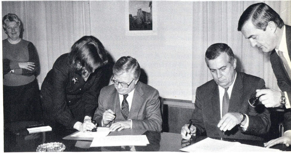
Gore: Senator Fulbrajt se 1964. sreo sa tadašnjim predsednikom Savezne skupštine Edvardom Kardeljem i predsednikom Spoljno-političkog odbora savezne skupštine Vladimirom Popovićem. Dole: Amandman na sporazum iz 1964. potpisali su 1984. ambasador Dejvid Enderson u ime Sjedinjenih Država i Miljenko Zrelec u ime Jugoslavije.

peno rađa uzajamno razumevanje i poverenje u namere i stremljenje i tako smanjuje netrpeljivost koja vodi sukobu.