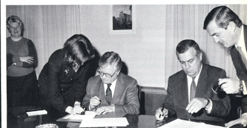
Gore: Senator Fulbrajt se 1964. sreo sa tadašnjim predsjednikom Savezne skupštine Edvardom Kardeljem i predsjednikom Spoljno-političkog odbora savezne skupštine Vladimirovom Popovićem. Dole: Amandman na sporazum iz 1964. potpisali su 1984. ambasador David Anderson u ime Sjedinjenih Država i Miljenko Zrelac u ime Jugoslavije.

Cilj Fulbrajtove programa nije samo unapređivanje naučnog rada već i gajenje ličnih kontakata između Jugoslavena i Amerikanaca. Taj cilj je Fulbrajtove program ostvario naročito uspešno. Iskustvo učesnika programa se zaista razlikuje od iskustva diplomata, poslovnih ljudi ili turista. Fulbrajtovec je često jedini Amerikanac u nekom mestu. Većina bivših Fulbrajtovac održava bliske veze sa zem-