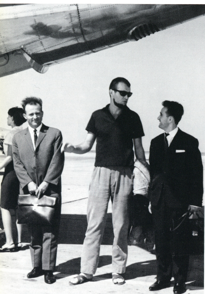
Godine 1964. predsjednik Tito je primio senatora Vilijama Fulbrajta (slika desno), a već sledeće godine su otputovali za Ameriku prvi Jugoslaveni koji su dobili Fulbrajtovu stipendiju za jednogodišnje studije (slika gore sleva) — Milan Zivković, Rajko Maksimović i Vojislav Božić.