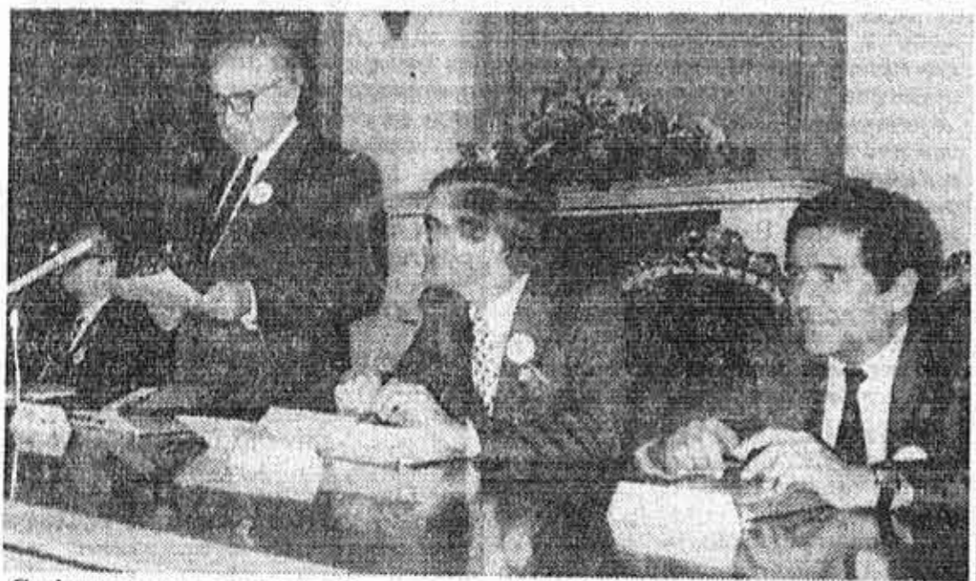
Са јучерашње седнице Председништва Заједнице универзитета Југославије

На свечаности је Комисији за просветну и културну сарадњу између Југославије и САД пре-