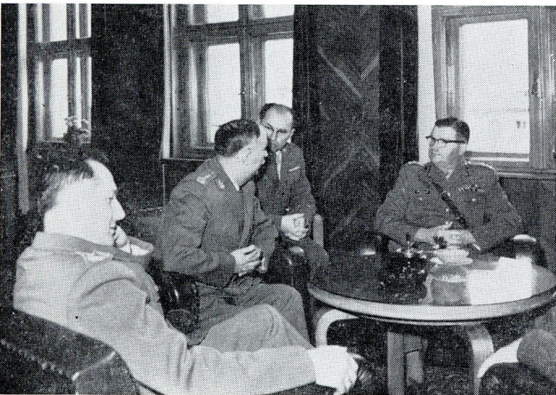
Predstavnici nacionalnog kanadskog Koledža za odbranu posetili su Vojnu akademiju u Beogradu