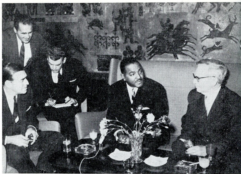
U Beogradu je boravio Karl Rouen, direktor američke agencije za informacije. Njegov domaćin bio je savezni sekretar za informacije Vilko Vinterhalter.