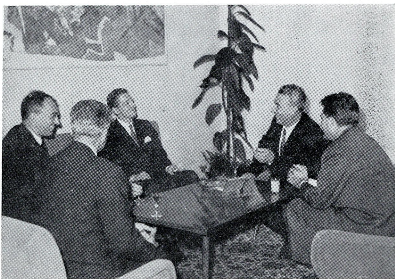
Novi kanadski ambasador u Jugoslaviji Ros Kempbel u protokolarnoj poseti kod potpredsednika Rankovića

Kanadska vlada, kanadske humanitarne organizacije i jugoslovenski iseljenici, angažovali su se oko pružanja pomoći Skoplju i Zagrebu.