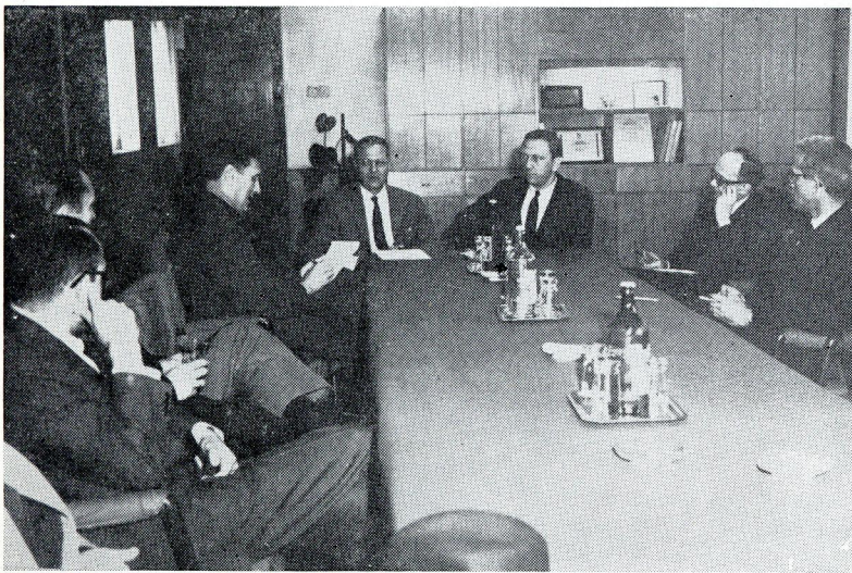
Američki senatori Henri Reus i Džon Bredemas boravili su krajem novembra u Jugoslaviji. Oni su tom prilikom razgovarali s istaknutim jugoslovenskim političkim i javnim radnicima.

U oblasti kulturne saradnje, u novembru je, u prisustvu senatora Fulbrajta, potpisan sporazum o kulturno-prosvetnoj razmeni.